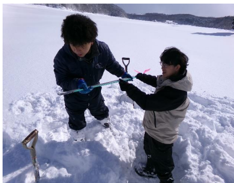
さてさて今年の積雪量は(??) なんと一番深い調査場所で237cm！昨年より37cmも多い積雪です(°o°； 他のも場所でも平均25cm多い積雪量でしたΣ( 口 ;)