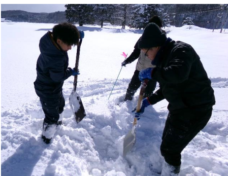
3/4 毎年恒例積雪量調査を行いましたべ(^~^*)/♪ 雪がもさもさ積もっているため、まずはスコップで掘り出します。よいしょ！よいしょ!!