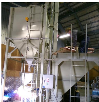
この時期になるといきなりあらわれるこの機械( < ) / 温湯消毒用種子の小分け作業にかかせないマシン！