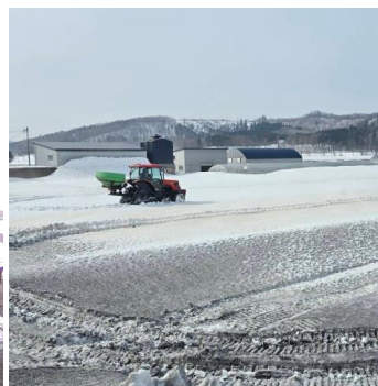
この時期の見慣れた風景といえば融雪剤散布！7~10日ほど雪が早く溶けますアゲケ(⊙▽⊙)アゲケ