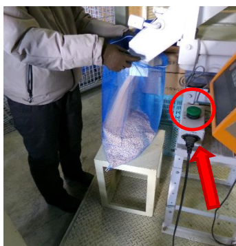
ボタンを押すと5kg程度の種子が量られ、排出用のレバーを傾けると勢いよく種子が溢れだします！