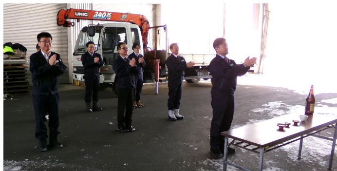
そう蔵開きです(∩^▽^∩)！ 倉庫の前に酒・水・米・塩をお供えし、今年一年の豊作と安全を祈願しました！1月の外はとてつもなく寒いですが、神様に失礼のないよう上着は羽織りません(´o`≡)(´o`≡)(´o`≡)