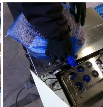
最後にネットの入り口をぐるぐるとねじり、機械にセットすればきつーく紐で結んでくれます！！(*^~^*)