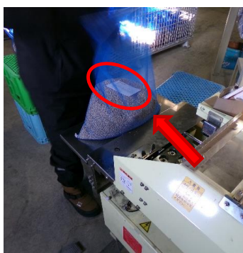
種子が入ったネットに耐水紙をIN！ 耐水紙には品種名・採種年月等の大事な情報が記されています(*-*)/