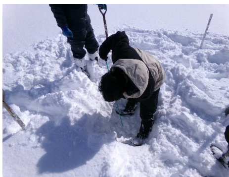
雪に棒を刺し、先端に土が付いたら深さを計測します！ ほど良く掘り進めたので、このあたりで棒を刺してみましょー—≡Σ((( つ・ω・)つ