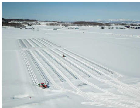
雪に埋もれたハウスの周りをトラクターがぐるぐるぐるぐる(◡◡◡)トラクターは何かをまいているようです(∇) この時期と言えば…