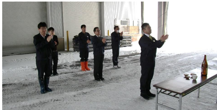
毎年恒例の蔵開きです！ 倉庫の前に酒・水・米・塩をお供えし、今年一年の豊作と安全を祈願しました！！米作り、米の受入・出庫と農業は常に危険と隣り合わせのためより一層気を引き締めていきます(((o(*▽*)o)))