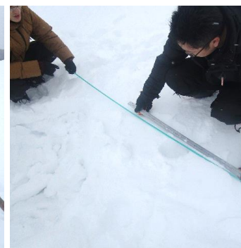
深さは169cm!(°▽°) 今年は雪が少ない印象でしたが、例年並みの積雪量でした(∇;) )