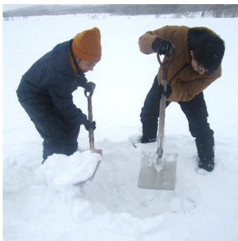
3/1 積雪量調査を行いました(*^ω^*)昨年の調査日より2週間ほど早いため雪がモリモリですw(∩)w