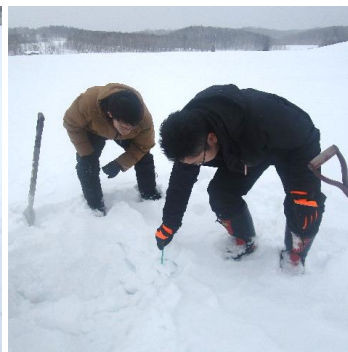
まずは雪に棒を刺し、先端に土が付いたことを確認します！ さあどうでしょうか(o^▽^)☆