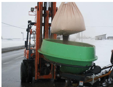
そう！融雪剤です(・ω・)この時期になると道の端にたくさんのフレコンが置かれ始めます。中身は全て融雪剤！黒いつぶつぶまみれです(・▽・)