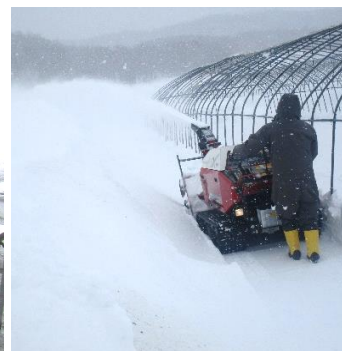
3月になると始まるのがハウスの除雪です(・ω・) 4月からの種まき・育苗に向けて準備しておきます！