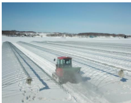
融雪剤は黒いため、光を吸収し熱せられます！ その熱さで雪が溶ける仕組み(@^0^@)/ まいておくと7~10日早く雪が溶けます(∇)

最後までお付き合いいただき、ありがとうございます。 束の間の農閑期が終わり、春作業前の準備期間に突入いたしました！ イェ——(∇)——イ!! 今年も北竜ひまわりライスへの変わらぬご愛顧のほど、よろしく願いいたします(∩*)、 それではまた、来月号でお会いしましょう！